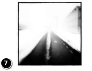
7 Fotoclub DFG