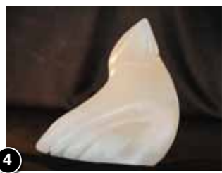
4 Ana de Koning