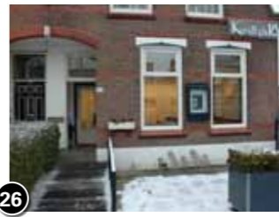
26 Kunsthuis 18