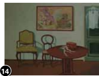
14 Mi-Tê Goeijenbier