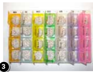
3 Fenneke Weltevrede