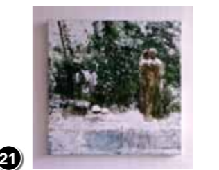
21 Lenny Droog-Wennekers