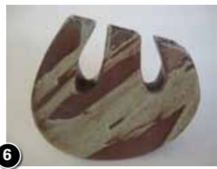
6 Catharine Pineau