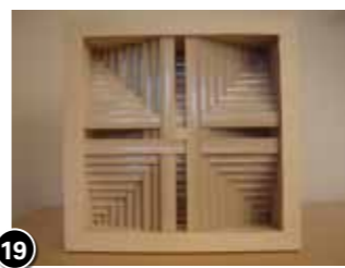
19 Dicky Slagter