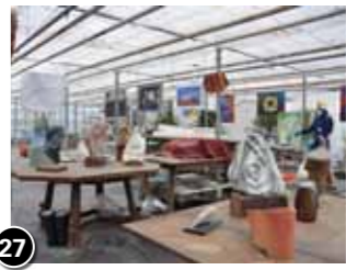
27 De Hakkers

westlandse kunst & atelierroute is mede mogelijk gemaakt door: