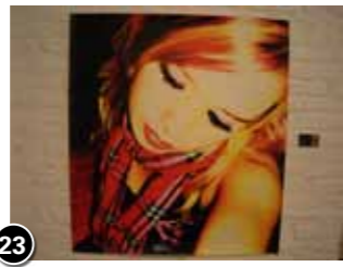
23 Floracollege kunstklas