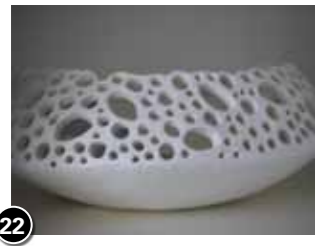
22 Tessa Droog ★ (detail)