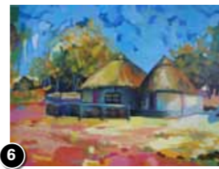
6 Anneke Verrips ★