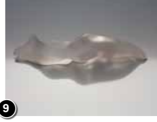
9 Ad Haring